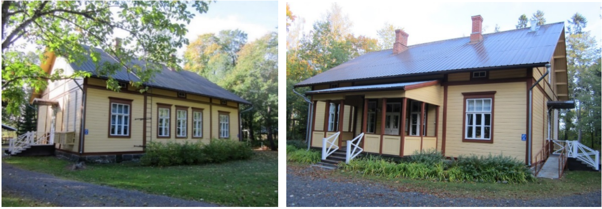
Kuva 4. Kapteenintalon julkisivu koilliseen ja lounaaseen, kuvattu 9/2018