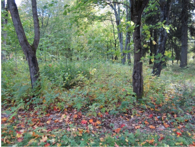
Kuva 7. Kasarmin kivijalka erottuu huonosti maastossa, kuvattu 9/2018