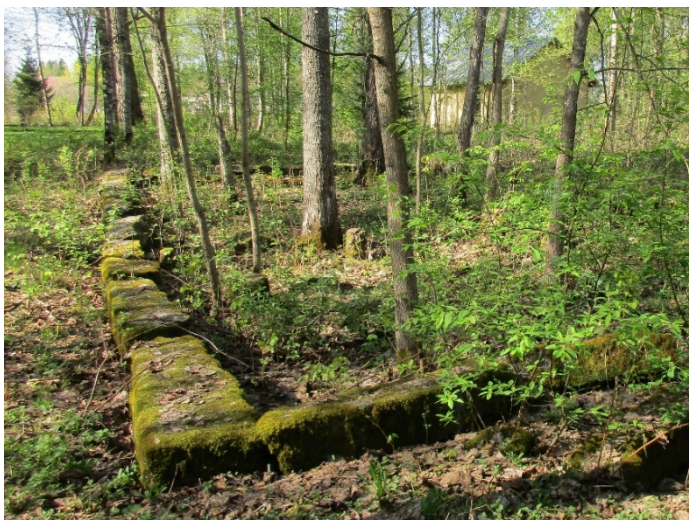
Kuva 9. Varusvaraston kivijalka. Kuvattu 05/2018