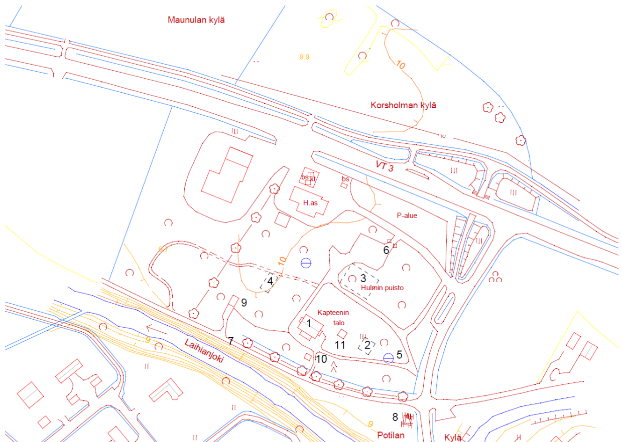
Kuva 1. Kartta alueella sijaitsevista rakennuksista ja rakennelmista sekä rakennusten jäänteistä