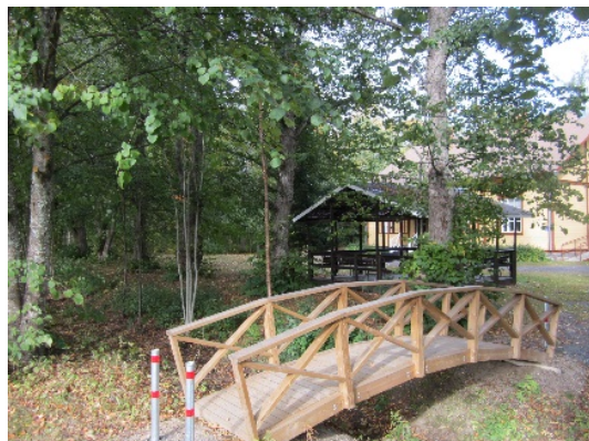
Kuva 12. Nykyinen varastorakennus ja kaarisilta, jonka taustalla tanssilava