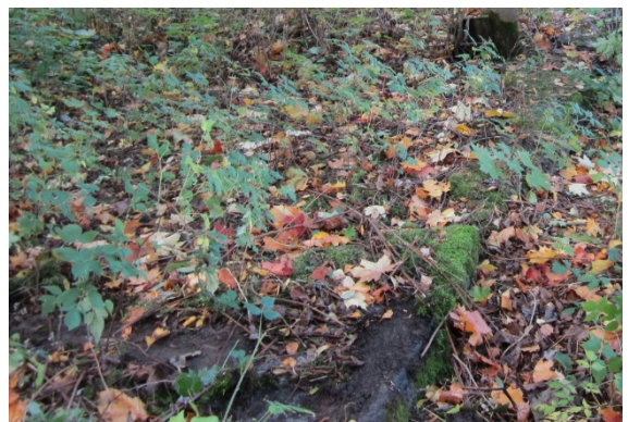
Kuva 6. Kivijalka on pääosin sammalen ja kasvillisuuden peitossa

2-kerroksinen kasarmi-/miehistörakennus rakennettiin vuonna 1883. Rakennuksen kivijalka on nykyään lähes maan tasalla ja monin paikoin sammalen ja kasvillisuuden peittämä.