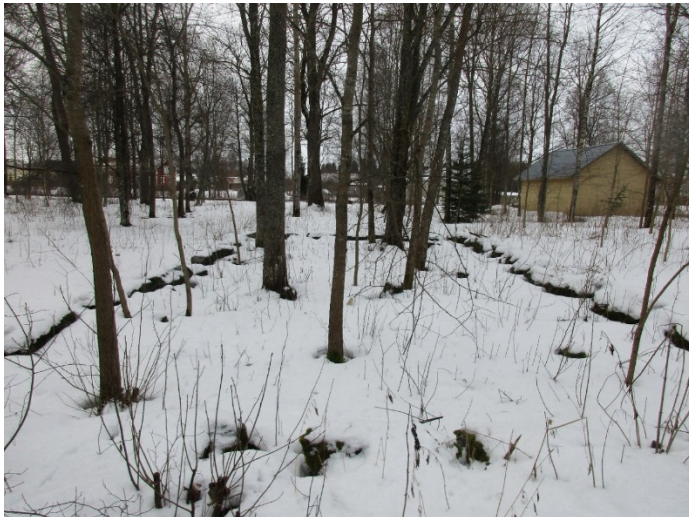
Kuva 8. Entisen varusvaraston kivijalka näkyy vielä osittain maastossa. Taustalla nykyinen varasto. Kuvattu 03/2018

Varusvarasto rakennettiin vuonna 1883 ja se oli hirsirakenteinen. Kivijalka näkyy vielä suurimmalta osin kahden kiven korkeudelle.