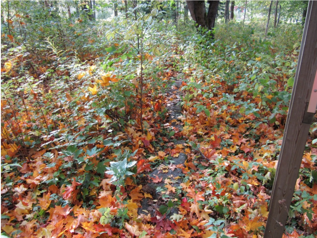
Kuva 5. Kivijalkaa luoteissivulta, kuvattu 9/2018

Vuonna 1883 rakennetun aliupseerirakennuksen kivijalka, joka on lähes maan tasalla.