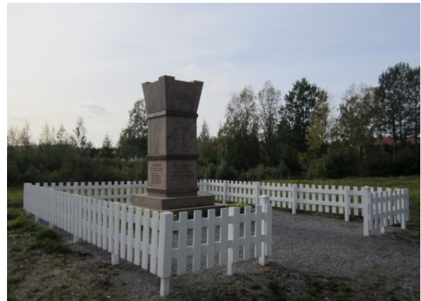
Kuva 11. Vasemmalla jokirannan vanha kolmostie ja oikealla Vapaussodan alkamisen muistomerkki vuodelta 1938