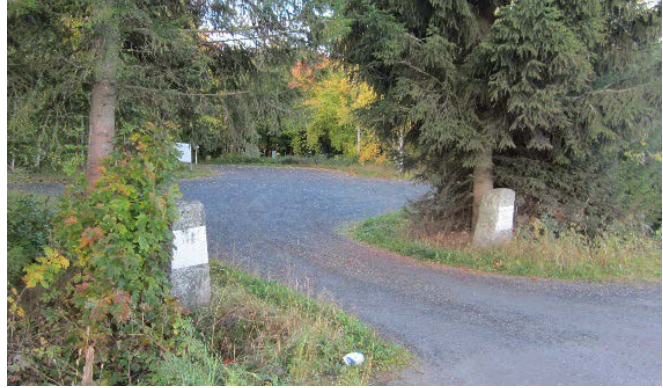
Kuva 10. Vanhan kaivon paikalla oleva uudempi kaivo ja porttikivet